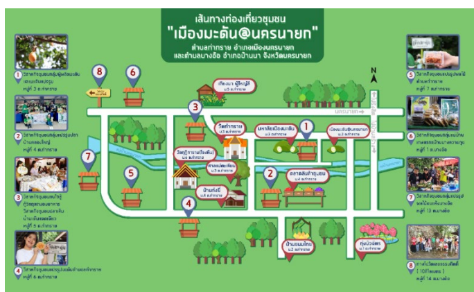
ภาพ 2 เส้นทางท่องเที่ยวเพื่อการเรียนรู้โดยนิตการมีส่วนร่วมของชุมชนเมืองมะดัน

4.2 รายการนำเที่ยว “วันเดียวเที่ยวเมืองมะดัน” ประกอบด้วย 1) กลุ่มทุ่งบัวฉัตร 2) กลุ่มวิสาหกิจชุมชน Rice Care 3) กลุ่มวิสาหกิจชุมชนกลุ่มผู้ผลิตและแปรรูปมะดัน 4) กลุ่มวิสาหกิจชุมชนแปรรูปปลาเค็มน้ำมะดัน 5) กลุ่มวิสาหกิจชุมชนกลุ่มปลาเค็มน้ำมะดันเด็ดเดี่ยว และกลุ่มวิสาหกิจชุมชนคนใจสู้กวีกฤตถนอมอาหาร 6) กลุ่มท่องเที่ยวชุมชนบ้านโรงหิน 7) กลุ่มอนุรักษ์ขนมไทยโบราณและกลุ่มวิสาหกิจชุมชนกลุ่มแปรรูปผลไม้ 8) กลุ่มวิสาหกิจชุมชนแม่บ้านเกษตรกรบ้านบางควายลุย 9) กลุ่มวิสาหกิจชุมชนแปรรูปผลไม้อบแห้งบางอ้อ