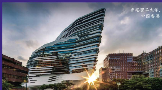
香港理工大学, 中国香港